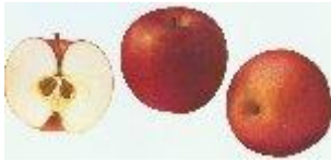
Apples of New York, 1905, Sa Beach.